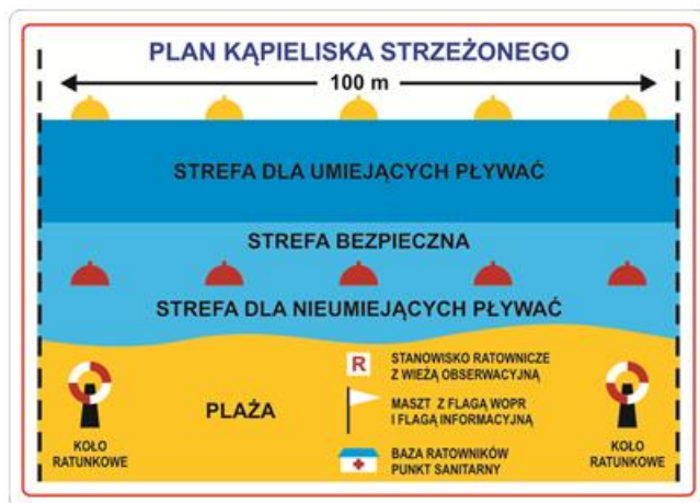
III - Schemat sytuacyjny kąpieliska Część wodna i przywodna Wykreślony z podaniem wymiarów rzeczywistych